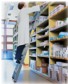
Ábra Megrend.-sz. 42408

A polclétrákat az Ön által megadott pontos függőleges beakasztási magasságban is elkészítjük. Ebben az esetben a legközelebbi méretű létra ára, valamint 42,00 Euró módosítási átalány kerül felszámításra. A méreetre gyártott polclétrak cseréje kizárt.