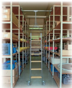
Ábra Megrend.-sz. 44306