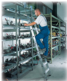
Ábra Megrend.-sz. 41408