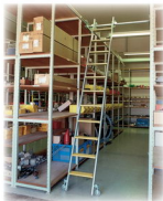
Ábra Megrend.-sz. 47311