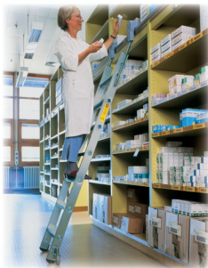
Ábra Megrend.-sz. 44407