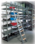
Ábra Megrend.-sz. 43308